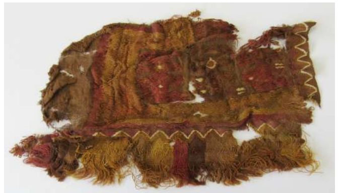
Fragmento de tejido estilo Chimú procedente de la PCR 13

La colección presenta algunos ejemplares de tejidos probablemente importados de la costa norte, vinculados a los estilos Chimú, Lambayeque (Tardío) y quizás Chancay. Algunos tejidos Ychma en técnica de tapiz y brocado copian diseños de la iconografía Lambayeque y Chimú.