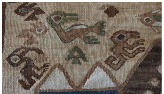
Tapiz de algodón con diseños de aves

Entre los motivos iconográficos destacan las figuras de aves estilizadas dispuestas en forma diagonal, aves bicéfalas, peces estilizados, serpientes bicéfalas, felinos y monos, personajes con tocado en posición frontal, diseños escalonados, olas y figuras de plantas. Muchas imágenes se relacionan a deidades marinas como en los parches de tapiz en forma de peces que probablemente representan especies como el lenguado o la pintadilla.