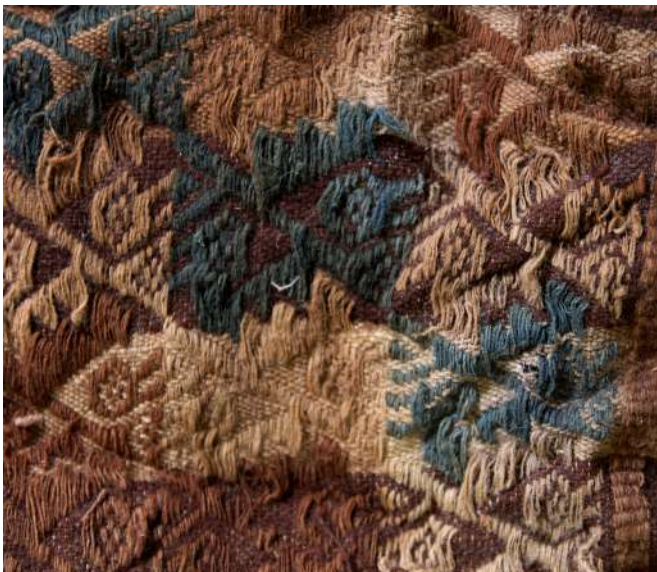
Tejido de algodón en técnica de brocado

Han sido identificadas más de quince técnicas de manufactura y predominan los tejidos llanos de algodón, los tapices ranurados, excéntricos y entrelazados y tejidos en técnica de cara de urdimbre. En menor proporción la muestra presenta tejidos de urdimbres y tramas discontinuas, urdimbres y/o tramas complementarias y suplementarias, y tejidos de cara de trama, gasa y doble tela. Además, se han encontrado muestras de fibra de camélido sin hilar, fibra de algodón y ovillos de algodón.