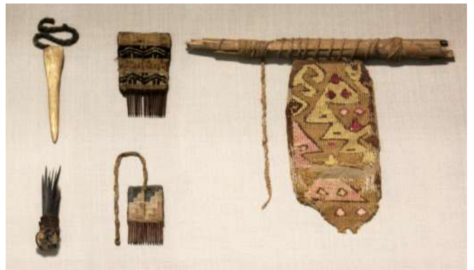
Instrumentos relacionados a la textilería

Dentro de los materiales recuperados han sido identificados husos de madera, piruros de cerámica, ovillos de hilos de algodón, conos de algodón preparado para el hilado e incluso una pequeña banda de tapiz en proceso de elaboración.