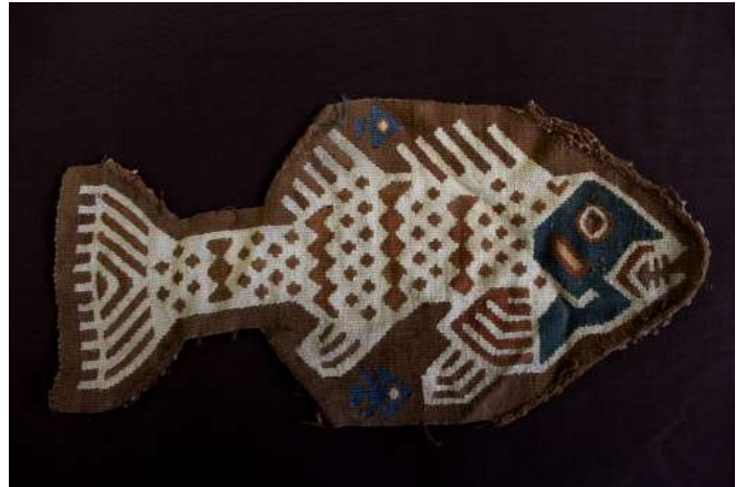
Panel de tapiz en forma de pez

En cuanto a su forma y función, se han identificado: paños de algodón, fragmentos de paños decorados, bolsas, vinchas, fajas, cintas, bandas llanas y decoradas, paneles en forma de pez, uncus en miniatura, fragmentos de flecos y borlas decorativas. También se han encontrado miniaturas de vestimenta masculina, fragmentos de vestidos femeninos, y taparrabos llanos.