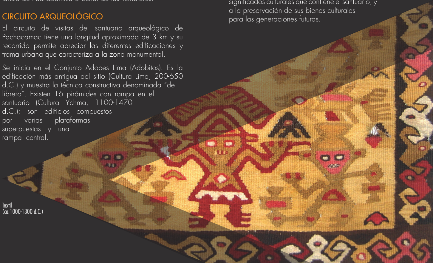
Textil (ca.1000-1300 d.C.)

Destacan la Pirámide con rampa 1, Pirámide con rampa 2 y Pirámide con rampa 3. El circuito permite apreciar desde los miradores otras edificaciones como el Templo Pintado (200-1470 d.C.), edificio donde se encontraba la deidad Pachacamac; el Acllawasi o Mamacona (Cultura Inca 1470-1533 d.C.) albergaba a mujeres elegidas para el culto y servicio del inca; además se aprecian otras edificaciones en el recorrido, ofreciendo en el Templo del Sol y en el edificio Taurichumpi (Cultura Inca 1470-1533 d.C.) un circuito secundario y perimetral que posibilita el reconocimiento detallado de la arquitectura y el entorno natural.