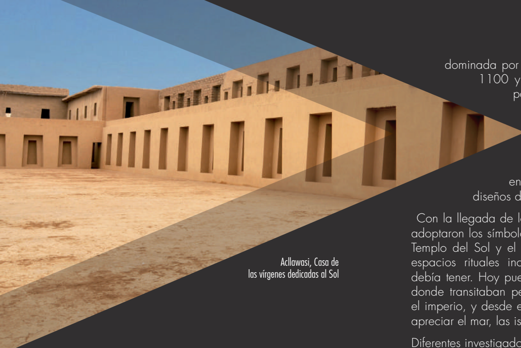
Acllawasi, Casa de las vírgenes dedicadas al Sol

Por más de mil doscientos años, durante el periodo prehispánico, Pachacamac fue el santuario más importante de la costa.