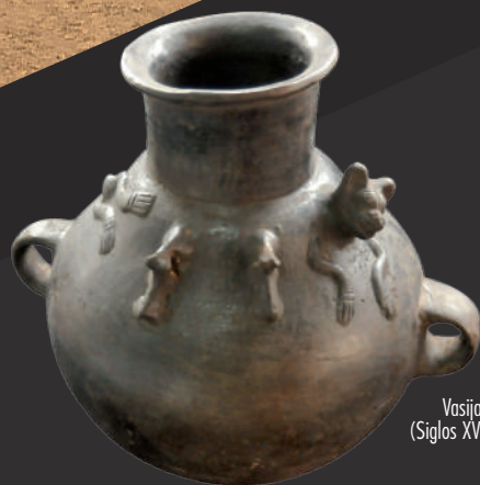
Vasija Inca (Siglos XV-XVI)