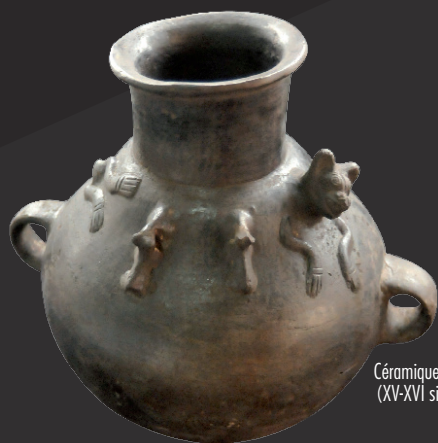
Céramique Inca (XV-XVI siècle)