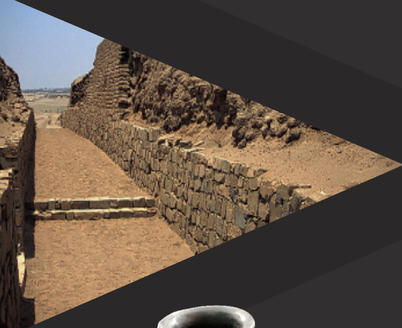
Chemin Inca, "Calle Norte-Sur"