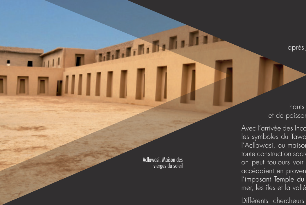
Acllawasi. Maison des vierges du soleil

après J.-C., la majeure partie de la citadelle religieuse fut construite, de grandes pyramides d'adobe (briques de terre) furent érigées et le grand temple peint en forme de pyramide à degrés fut construit, avec des murs hauts en couleurs ornés de motifs d'oiseaux et de poissons.