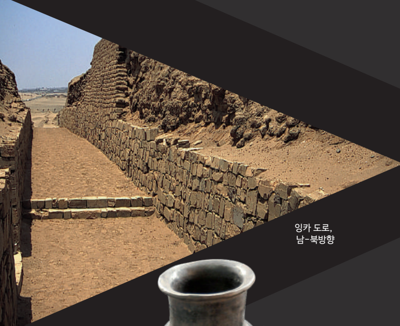
잉카 도로, 남-북방향