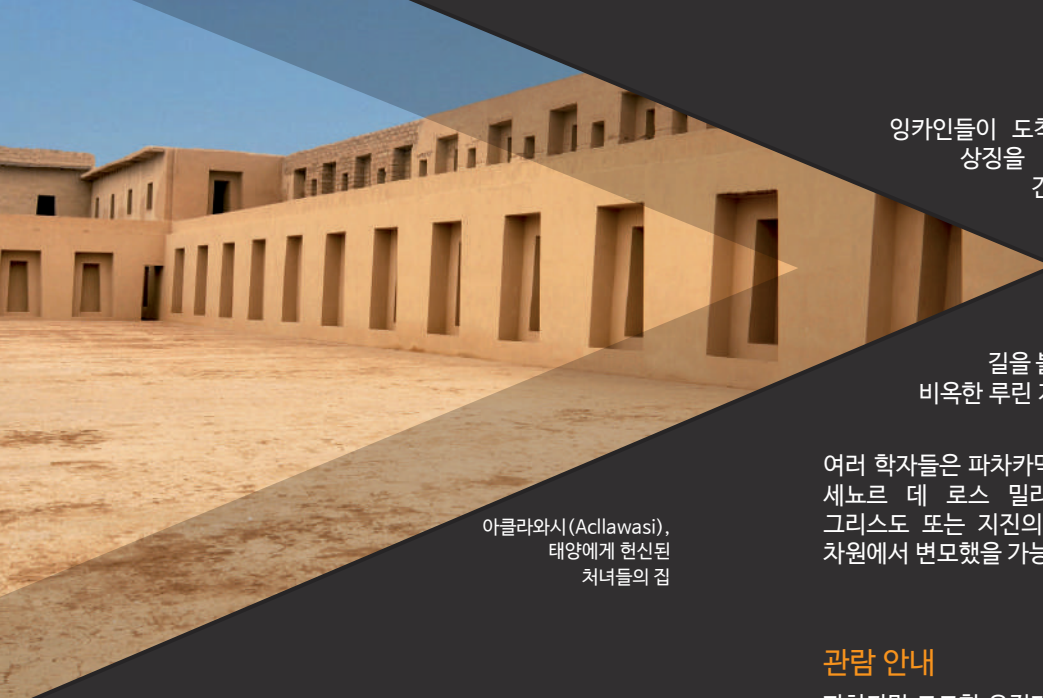
아클라와시(Acllawasi), 태양에게 헌신된 처녀들의 집

잉카인들이 도착한 후, 파차카막의 사제들은 잉카의 상징을 받아들였고, 그 시기 모든 신성한 건축물이 갖춰야 했던 잉카 의식 공간인 태양의 신전과 아클라와시(선택받은 자들의 집)를 지었습니다. 오늘날에도 잉카제국 전역에서 온 순례자들이 걸던 길을 볼 수 있으며, 태양의 신전에서 바다와 섬, 비옥한 루린 계곡을 감상할 수 있습니다.