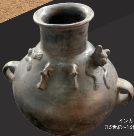
インカの壺 (15世紀~16世紀)