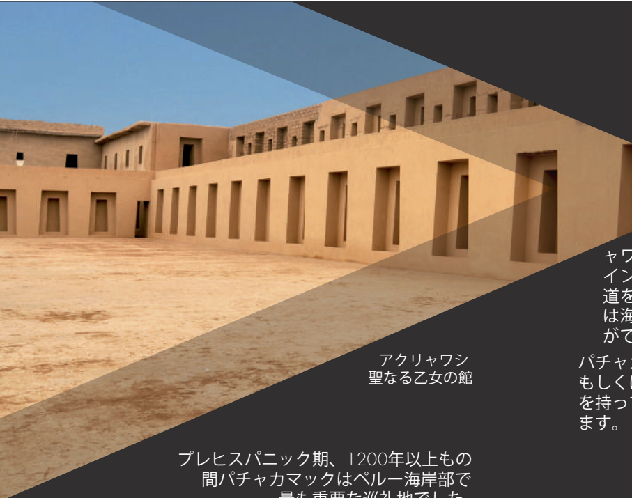
アクリャワシ 聖なる乙女の館

プレヒスパニック期、1200年以上もの 間パチャカマックはペルー海岸部で 最も重要な巡礼地でした。