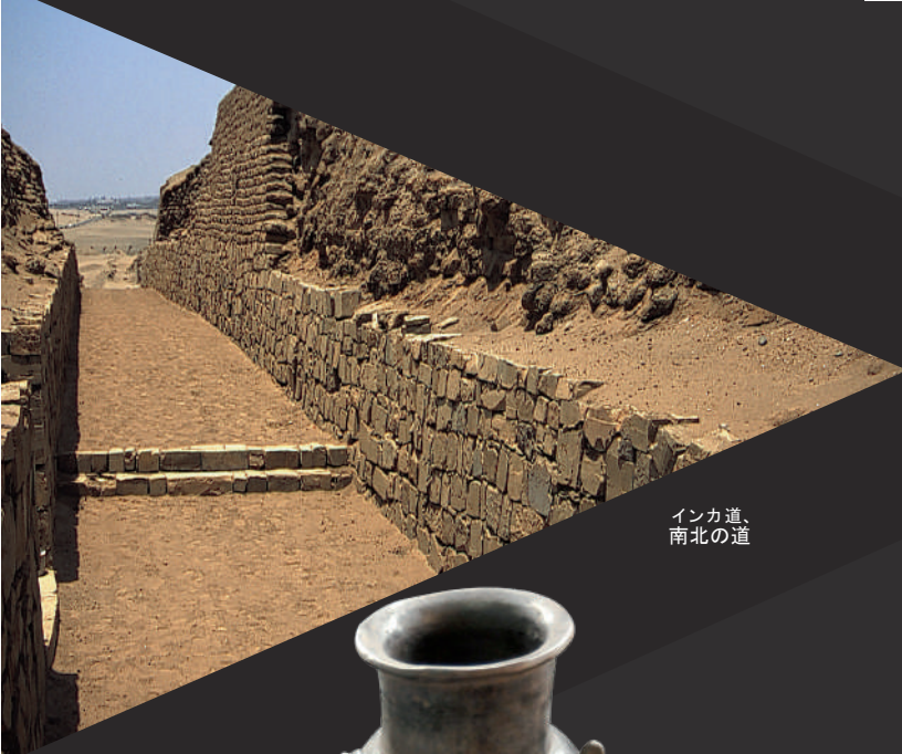
インカ道、 南北の道