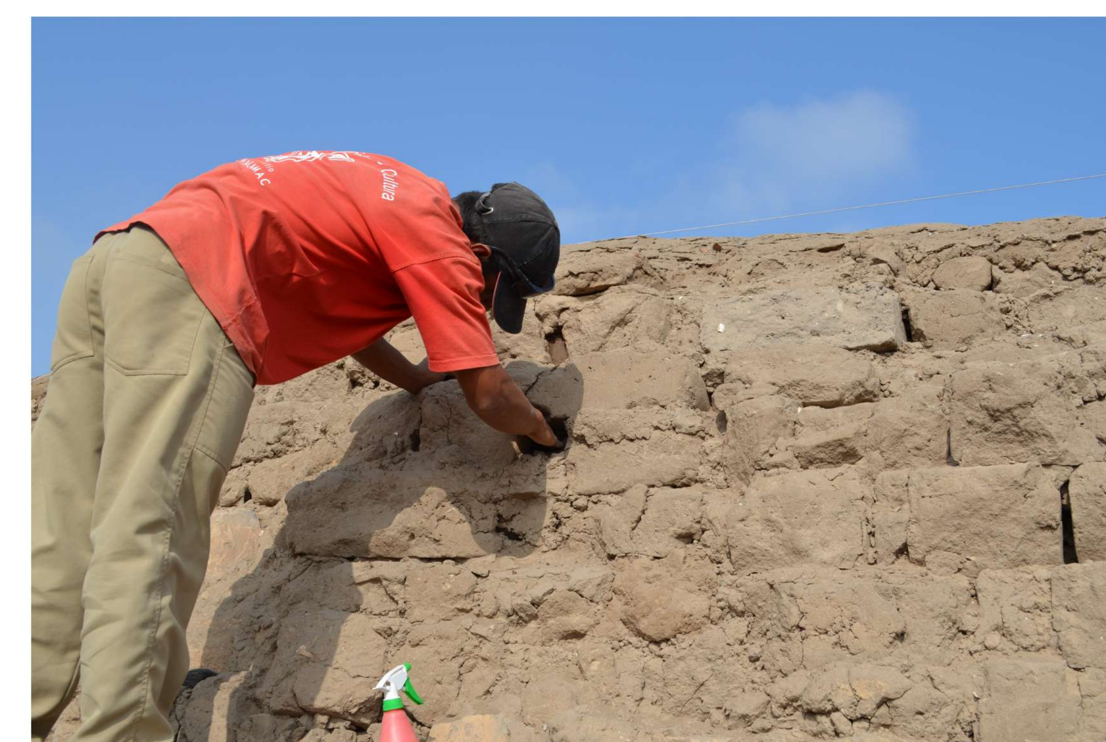
Durante las labores de conservación en la muralla