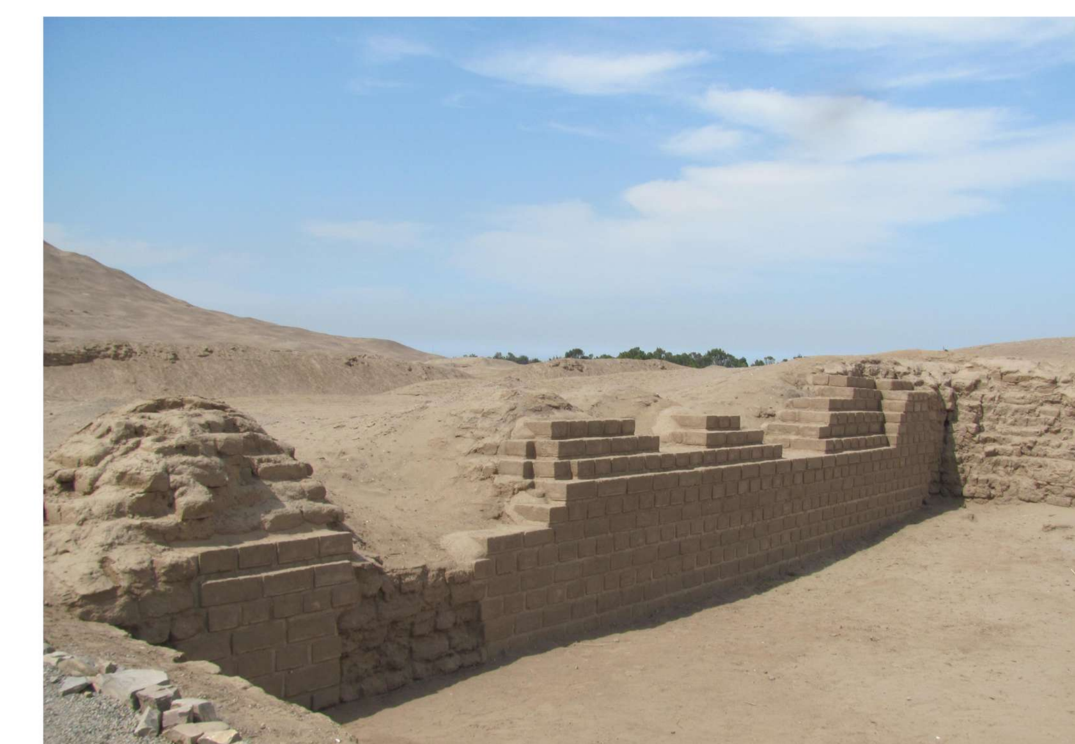
Después de la conservación