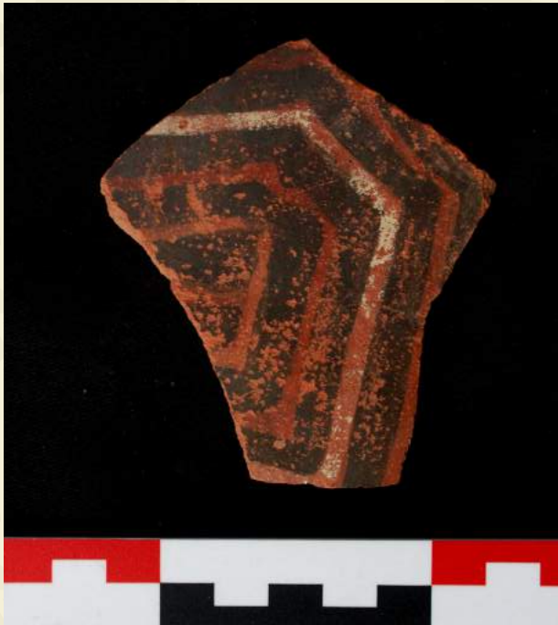
Cerámica de estilo Lima Medio.

Los materiales Wari del inicio del Horizonte Medio, es decir de las primeras influencias de Wari desde Ayacucho a Pachacamac son muy escasos. Predomina la cerámica de estilo Lima Tardío, en menor grado de estilo Nievería y escasos fragmentos Cerro de Oro. Este último estilo sugiere, que para este periodo, las relaciones con la costa sur central se mantienen.