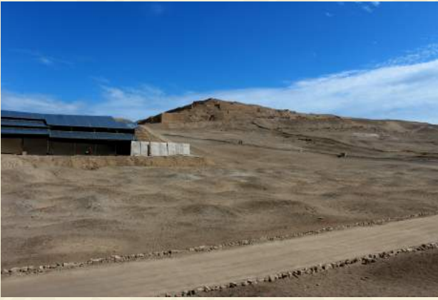
Cementerio Uhle y Templo Pintado.