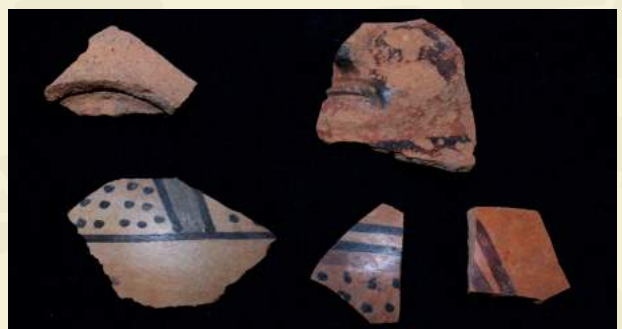
Cerámica estilo nievería

La cerámica proviene de los escombros producto de la destrucción del templo durante la colonia, así como del saqueo indiscriminado en el Cementerio Uhle a lo largo de los años. A pesar de proceder de contextos secundarios, el material nos ha permitido conocer los estilos de cerámica presentes en el área.