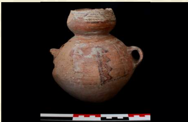
Cerámica tricolor geométrico.

Los materiales Wari del inicio del Horizonte Medio, es decir de las primeras influencias de Wari desde Ayacucho a Pachacamac son muy escasos. Predomina la cerámica de estilo Lima Tardío, en menor grado de estilo Nievería y escasos fragmentos Cerro de Oro. Este último estilo sugiere, que para este periodo, las relaciones con la costa sur central se mantienen.