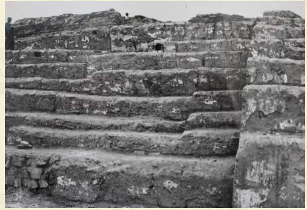
Templo Pintado, excavaciones de Giesecke en 1938.