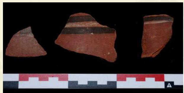
Cerámica de estilo Lima Tardío.

La presencia de algunos fragmentos de cerámica Lapa Lapa y Capilla, estilos propios del periodo Intermedio Temprano de los valles de Chilca, Mala y Asia, sugieren relaciones entre Pachacamac y la costa sur central para este periodo.