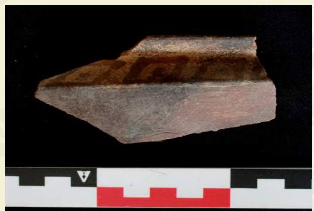
Cerámica Ychma Tardío.