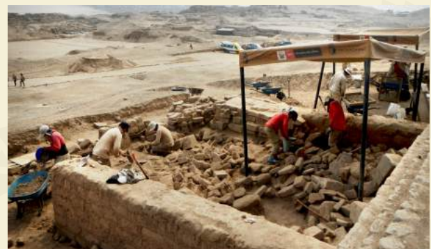
Unidad 1. Excavación de acumulación de escombros.

frontis norte del edificio, así como restos de fardos funerarios disturbados del Cementerio Uhle.