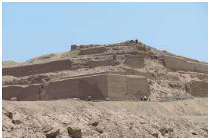
Fig. 4. Vista de la esquina Noreste del Templo del Sol en la actualidad.