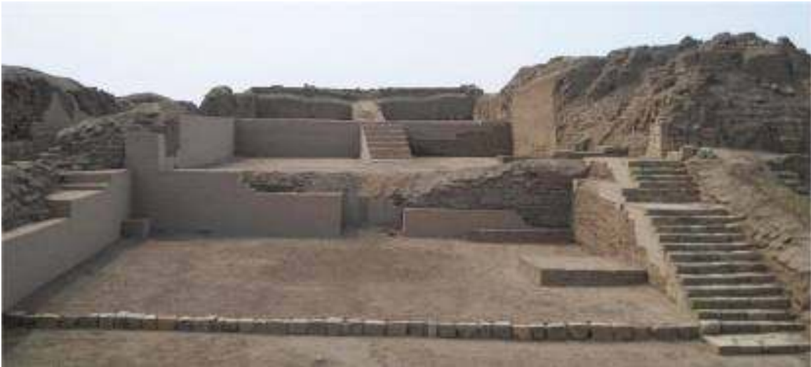
Fig.6. Intervenciones realizadas por J. Ramos en la plaza lateral de la PCR 01.