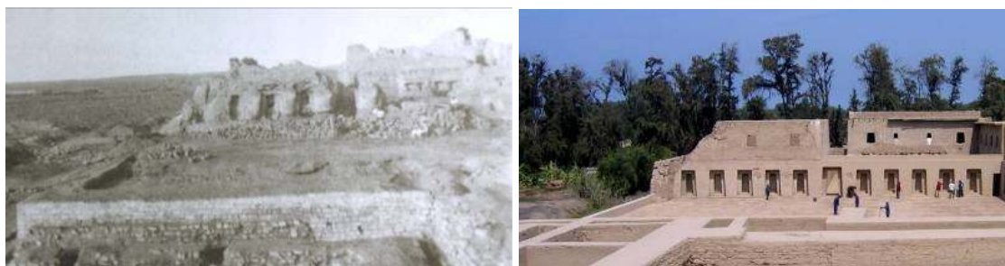
Fig. 9 A) y B). Destrucción del Acllawasi producida por 500 años de terremotos e imagen del edificio reconstruido y en su estado actual.

Existe una nota en el archivo Tello que expresa que la construcción con materiales locales (tierra, paja, caña), se realizó sobre los escombros de un Acllawasi construido en piedra por los Incas, que los terremotos colapsaron. Tras su reconstrucción en el siglo XX, el edificio soportó cuatro movimientos sísmicos de mediana intensidad (1966, 1970, 1974 y 2007), los cuales produjeron los daños estructurales que actualmente se observan (Fig. 9-B). El análisis estructural realizado por Vargas determinó la existencia de deficiencias constructivas en la reconstrucción, como la fundación sobre material de relleno o depósitos de arena suelta, la mala calidad de la tierra usada para la fabricación del adobe, el excesivo espesor del mortero de junta, la deficiente trabazón entre los bloques de adobe, el uso de dinteles cortos y la inexistente conexión entre techos y muros ( 3 ).