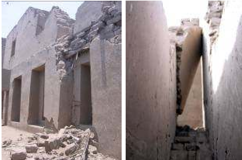
Fig. 10 A) y B). Efectos del sismo del 15 de agosto del 2007.

importante: La Citadelle de Arg-e-Bam, Irán, destruida en Diciembre del 2003” (Vargas 2008: p.23).