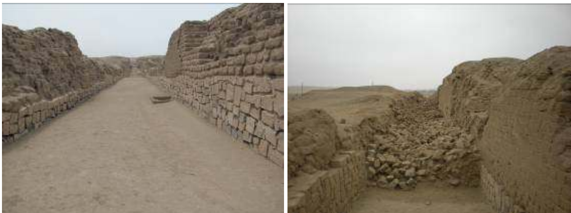
Fig. 7- A) y B) Vista del tramo norte de la Calle Norte-Sur excavado en 2009 y vista desde el sur de los muros colapsados por efecto de los sismos.

La Calle Norte-Sur, principal vía de acceso y circulación interna del santuario, fue construida por los Ychma entre los años 1380 a 1440 d.C., y estuvo interconectada al camino Inca denominado Qhapac Ñan. La calle estaba delimitada por dos muros de piedra y adobe de 3 m. de ancho y de 4 a 6 m. de alto (Fig.7-A). La base fue construida dentro de una zanja de 30 cm. de profundidad, directamente sobre apisonados endebles o arena. La falta de una base sólida y las características del suelo representaron, en sus primeros años de uso, un problema estructural que fue aminorado por el reforzamiento de la base debido a la acumulación progresiva de arena eólica.