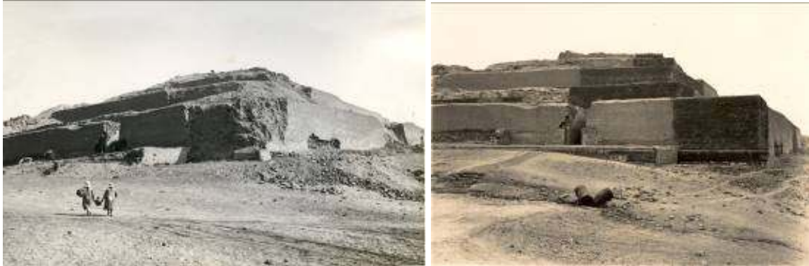
Fig. 3. A) y B) Vista de la esquina Noreste del Templo del Sol antes y después de su conservación.

estructurales del edificio están siendo estudiados minuciosamente y analizados de manera interdisciplinaria.