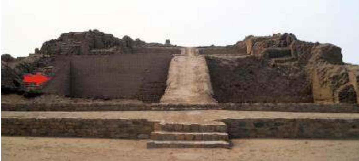
Fig. 5. La flecha roja indica el área intervenida por Jiménez Borja en el frontis Noreste del edificio principal de la PCR 01.

adobes nuevos de menor tamaño que los originales (Zegarra 1961-62), ya que no fue posible utilizar los adobes originales rotos a causa del sismo ocurrido en época colonial.