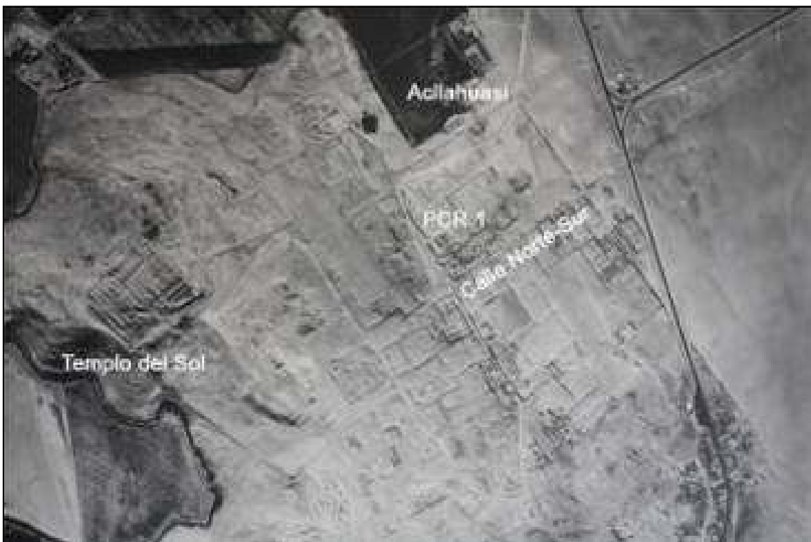
Fig.1. Santuario de Pachacamac, Lima, Perú.

Las más de 20 estructuras monumentales que componen el santuario (Fig.1) fueron construidas en base a adobe (1) y piedra, y están emplazadas sobre un promontorio rocoso cubierto por arena de origen eólico. Por su ubicación geográfica y las características constructivas descritas, el sitio debió soportar innumerables movimientos sísmicos ocurridos durante sus más de 1200 años de historia (Ver tabla 1). Incluso, fue en Pachacamac donde los conquistadores españoles registraron el primer movimiento sísmico histórico del Perú, ocurrido en enero de 1533 (Seiner 2009:85).